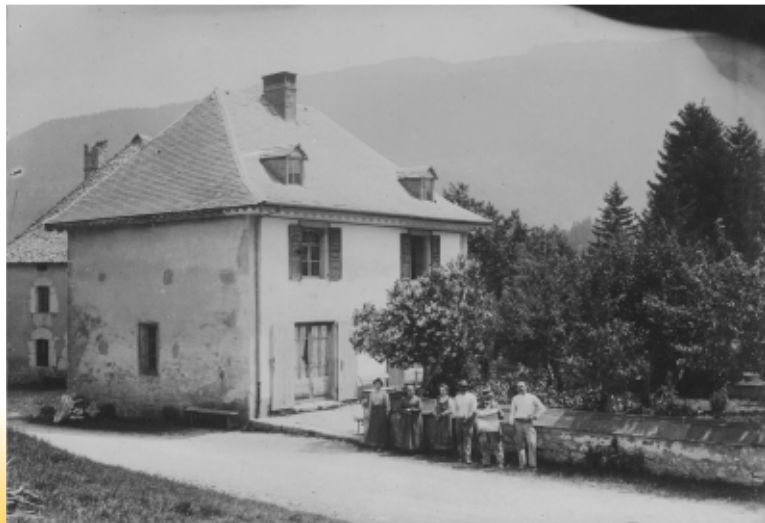
Le bâtiment de hôtel-restaurant "l'Atre Fleuri"

Si vous le souhaitez, vous pouvez nous en confier, nous vous les retournerons après numérisation. Merci.