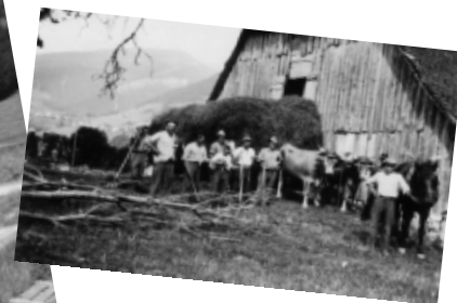
La grange Brevard (ruine en face de l'Atre Fleuri)

CONSEIL MUNICIPAL DU 09 JUILLET 2010 : Désaffectation du « parking du bourg » - Plan Local d'Urbanisme : débat sur les orientations générales du projet d'aménagement et de développement durable (P.A.D.D.), en application de l'article L.123-9 du code de l'urbanisme.