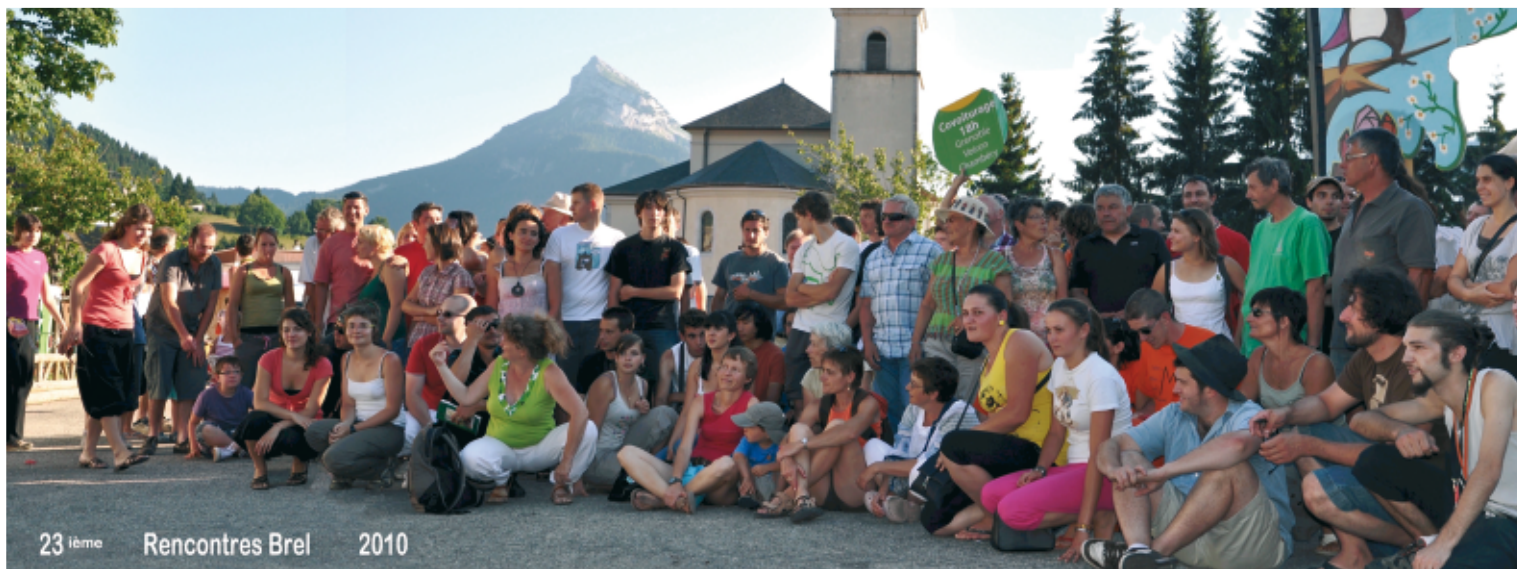
Quelques uns des 240 bénévoles des Rencontres BREL

manifestations, l'automne sera ponctué de moments incontournables. L'association «Pic Livre», dans le cadre de la tournée de MC2, a programmé un spectacle intitulé "Spectacle 2 ou 3 grammes" le 5 décembre à 20h00 à la salle des fêtes et le «Sou des écoles» organisera à la salle des fêtes une Bourse aux Skis et Vêtements le 14 novembre de 10h00 à 18h00 ainsi que la Fête de Noël le 10 décembre à 18h30 à la salle des fêtes . L'Office de Tourisme reste à votre disposition pour vous informer d'autres animations dont l'information ne nous serait pas parvenue.