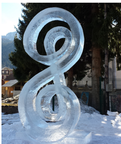
25 & 26-02 : Biennale neige & glace