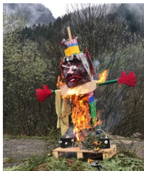
01-04 : Carnaval du Sou des Ecoles