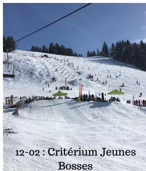
12-02 : Critérium Jeunes Bosses