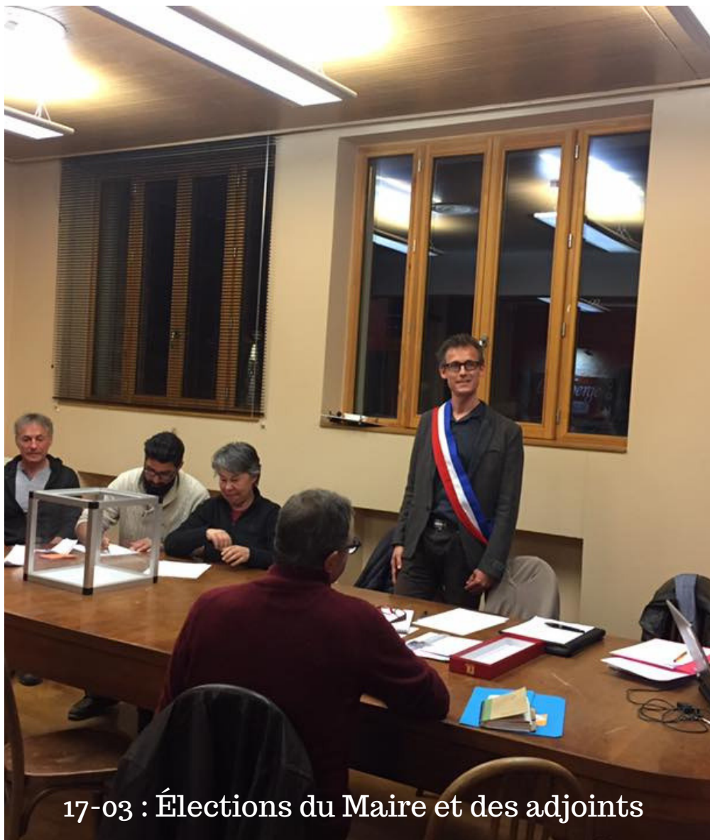
17-03 : Élections du Maire et des adjoints