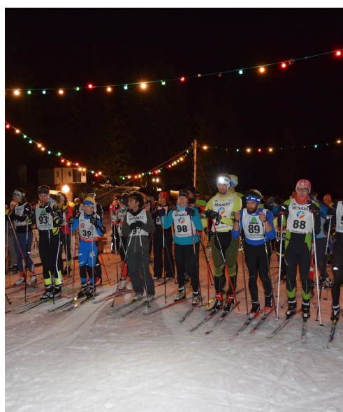
03-03: Finale des Nocturnes Chartreuse