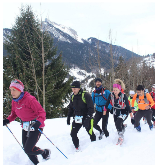
21 & 22-01 : Winter Trail 2017